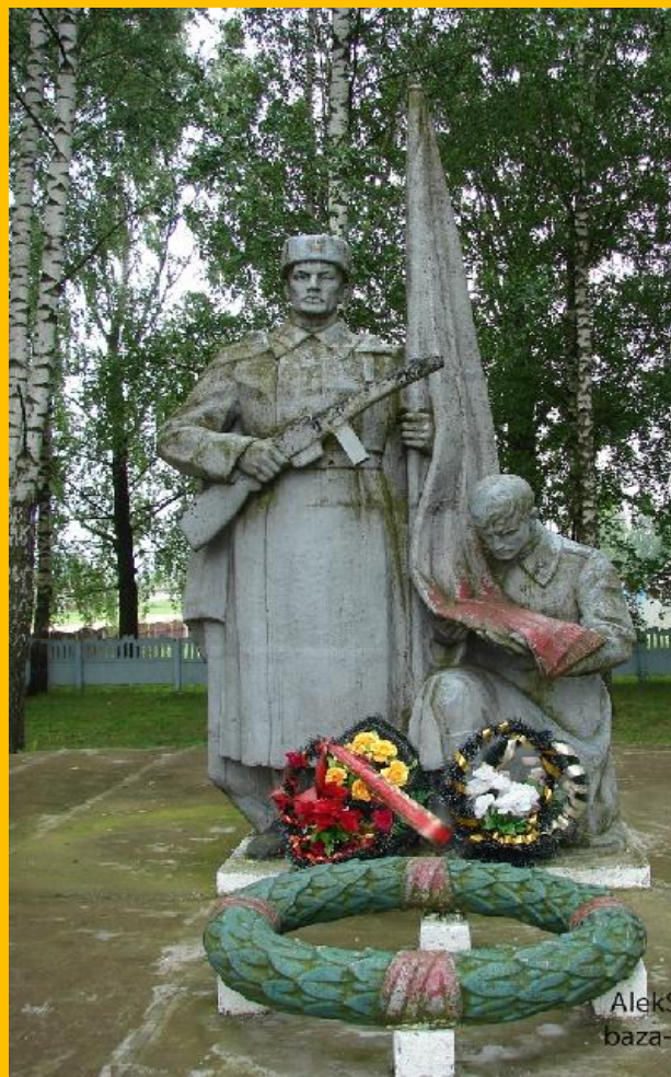
Мемориал воинской славы. Могилёвская область, Чаусский район, деревня Антоновка

Дедушка Слава посвятил своему отцу такие строки: